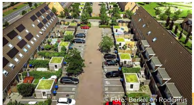
Foto: Berkel en Rodenrijs

Soesterberg en Eindhoven. In totaal staat de teller nu op 447 groene daken in opdracht, samen goed voor meer dan 4.000 m 2 groen dak! Groene daken zorgen voor wateropvang, koeling, biodiversiteit en woongenot voor onze huurders.